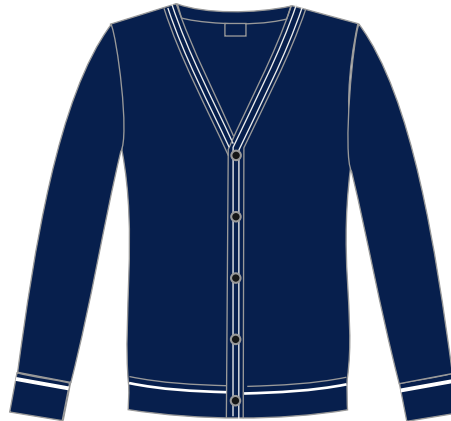
Toote kood: VALO 02 Laste kardigan poistele ja tüdrukutele Suurused: 116-164 Materjal: 50% peen meriino vill, 50% polüakrüül Hind: 39,00 EUR