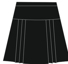
Toote kood: EMMA Tüdrukute seelik Värvus: must Materjal: 100% polüester Suurused: 110-176 HIND: 34,00 EUR