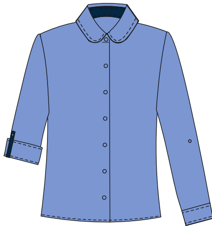
Tüdrukute pluus MINNA Värvus: helesinine ja valge siniste detailidega Suurused: 128-168 Materjal: 55% puuvill, 45% polüester Hind: 36,00 EUR