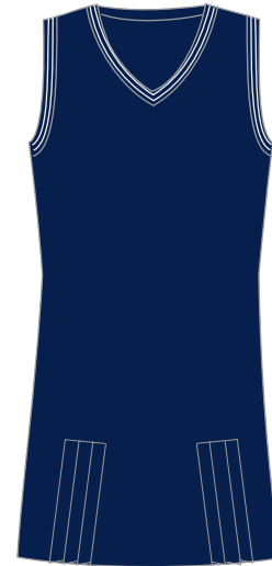
Toote kood: VIRGE 25 Pihikseelik tüdrukutele Suurused: 116-164 Materjal: 50% peen meriino vill, 50% polüakrüül Hind: 36,00 EUR