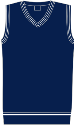
Toote kood: VIO 01 Laste vest poistele ja tüdrukutele Suurused: 116-164 Materjal: 50% peen meriino vill, 50% polüakrüül Hind: 30,00 EUR