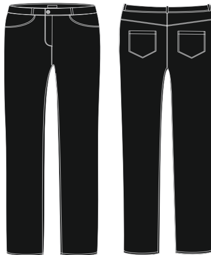
Toote kood: EGERT Poiste püksid Värvus: must Suurused: 116-188 Materjal: 93% puuvill, 5% polüester, 2% lycra Hind: 46,00 EUR